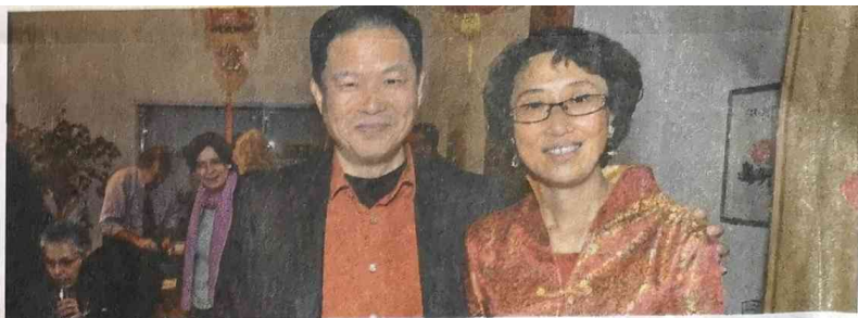
Die Veranstalter des Feierns-China Medici TCM-Centrum Paderborn und Verein für Deutsch-Chinesische Freundschaft haben über die zahlreiche Besucher sehr gefreut. Es zeigte sich große Interesse sowohl an den bunten Programmen als auch an dem Miteinander zu sein.